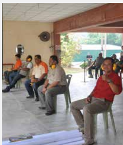
Peserta kursus sedang mendengar taklimat yang disampaikan jurulatih