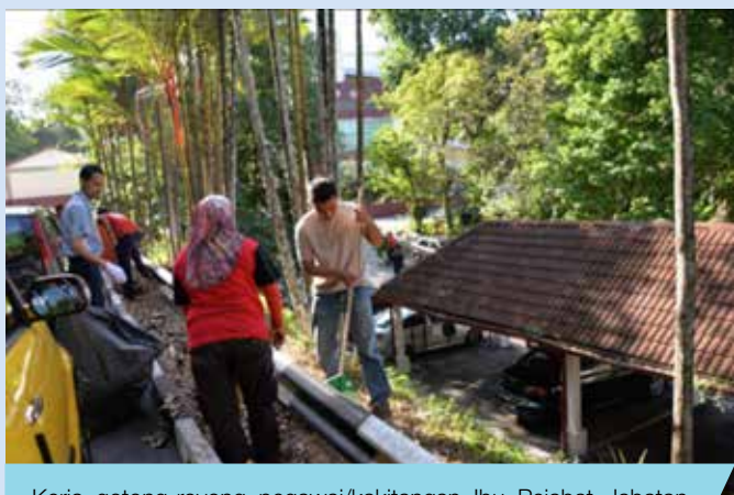
Kerja gotong-royong pegawai/kakitangan Ibu Pejabat Jabatan Perhutanan Semenanjung Malaysia.