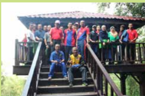
Tuan Pegawai Daerah Batu Pahat bergambar bersama Pegawai Hutan Daerah Johor Tengah, Kluang di tingkat atas menara pandang Hutan Lipur Soga Perdana

Program karnival ini dimulakan dengan aktiviti penanaman anak pokok dan seterusnya gotong royong membersihkan kawasan hutan lipur.