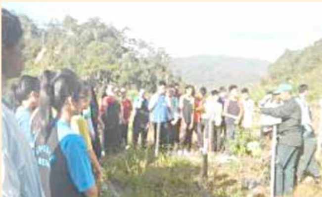
Taklimat cara penanaman pokok oleh YM. Tengku Ishamuddin bin Tengku Kasim, Penolong Pegawai Perlindungan dan Pemeliharaan Hutan, Pejabat Pembangunan Hutan Pahang Barat

Oleh yang demikian, Program Penghijauan Cameron Highlands ini akan sentiasa dilaksanakan dengan melibatkan lebih ramai orang awam bagi memastikan objektif Jabatan dalam memberi kesedaran kepada masyarakat umum terhadap pemeliharaan alam sekitar tercapai.