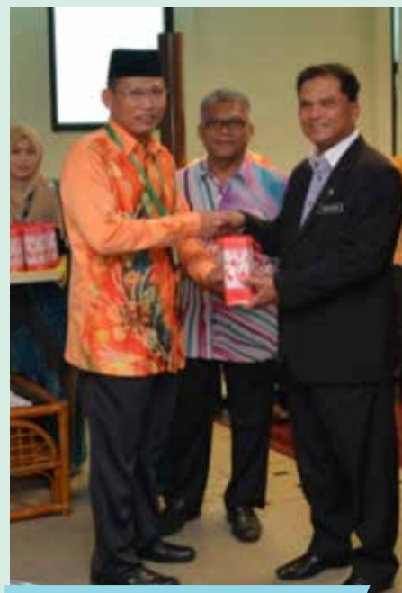
Penyampaian hadiah hari lahir kepada kakitangan JPNJ