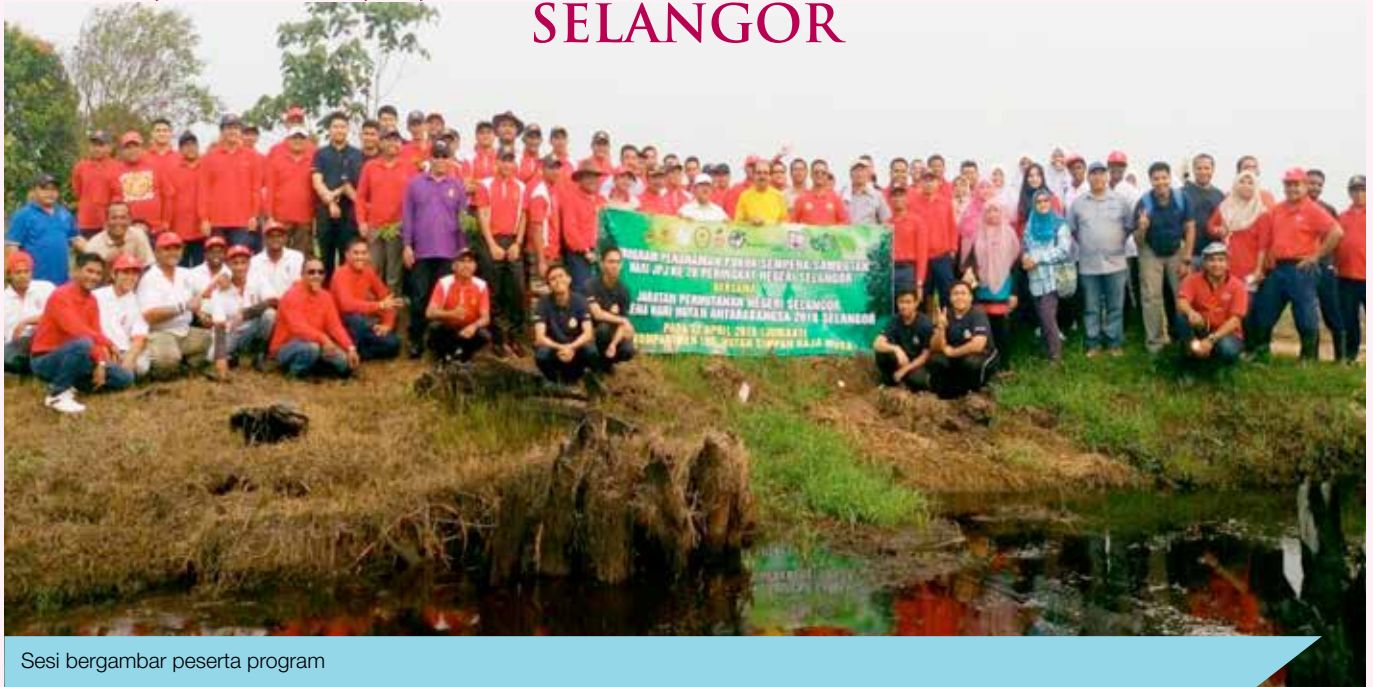
Sesi bergambar peserta program