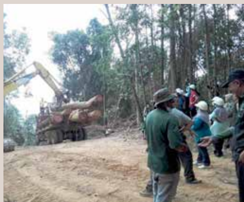
Peserta melihat cara-cara/kaedah memindahkan kayu ke dalam lori San Tai Wong