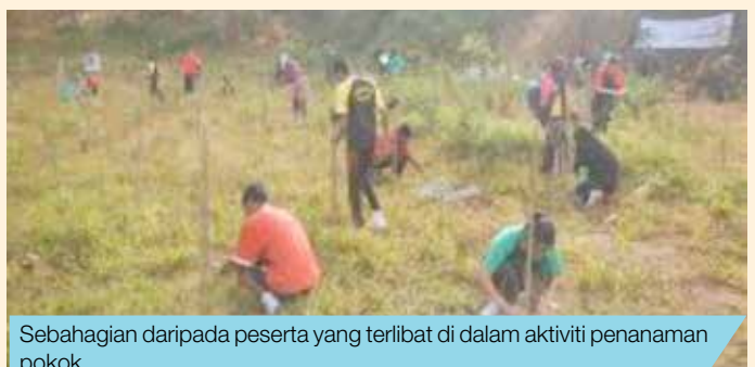
Sebahagian daripada peserta yang terlibat di dalam aktiviti penanaman pokok.