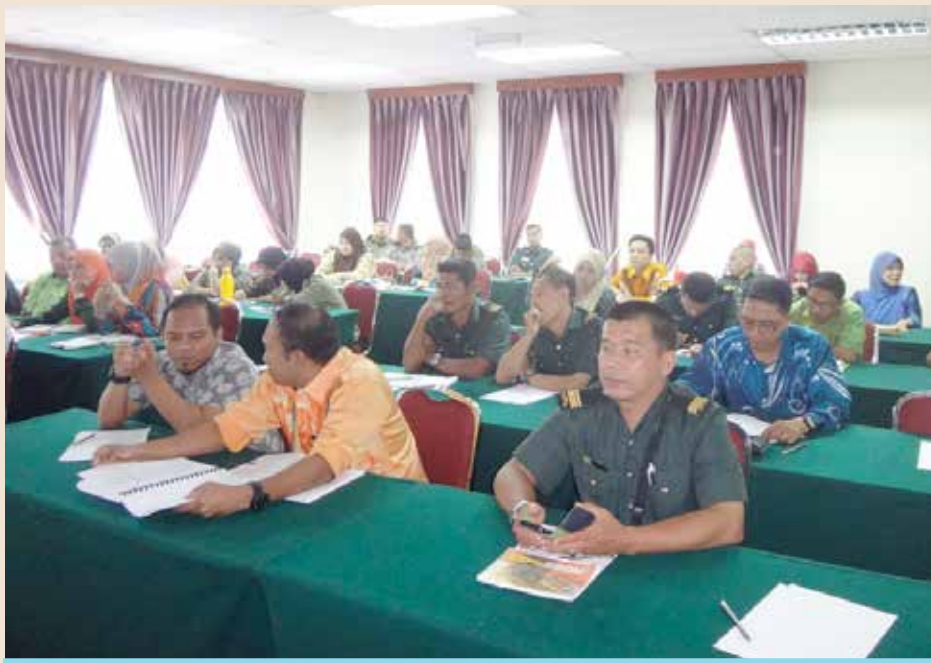
Para peserta sedang mendengar taklimat mengenai pengurusan aset dan stor