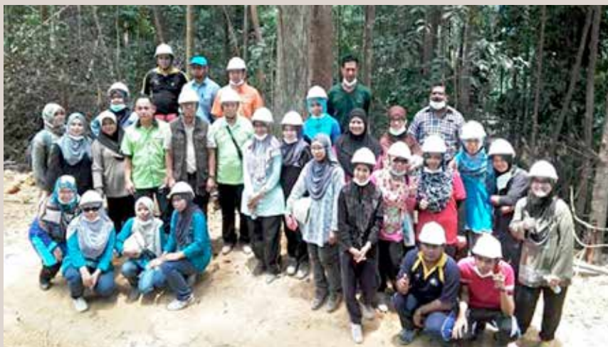
Peserta program lawatan bergambar bersama YBhg. Dato' Timbalan SUK dan YBhg. Dato' PPN Pahang di kawasan blok lesen