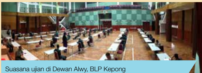
Suasana ujian di Dewan Alwy, BLP Kepong

Disediakan oleh: Siti Hawa binti Parmen Jabatan Perhutanan Negeri Johor