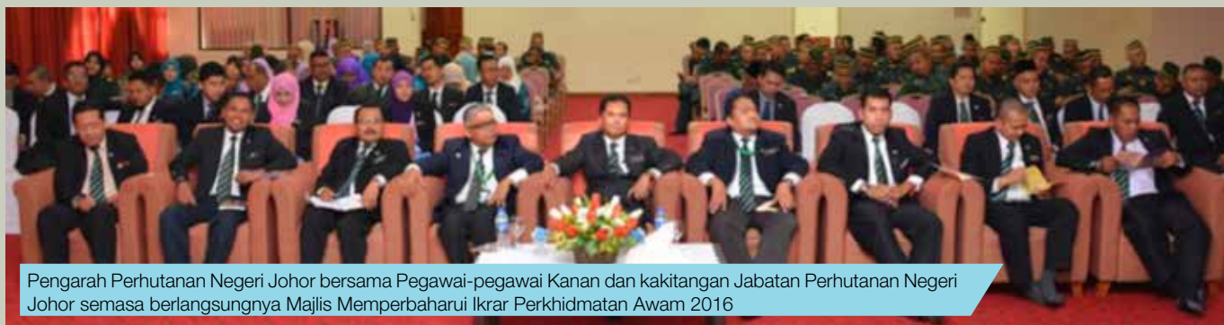
Pengarah Perhutanan Negeri Johor bersama Pegawai-pegawai Kanan dan kakitangan Jabatan Perhutanan Negeri Johor semasa berlangsungnya Majlis Memperbaharui Ikrar Perkhidmatan Awam 2016