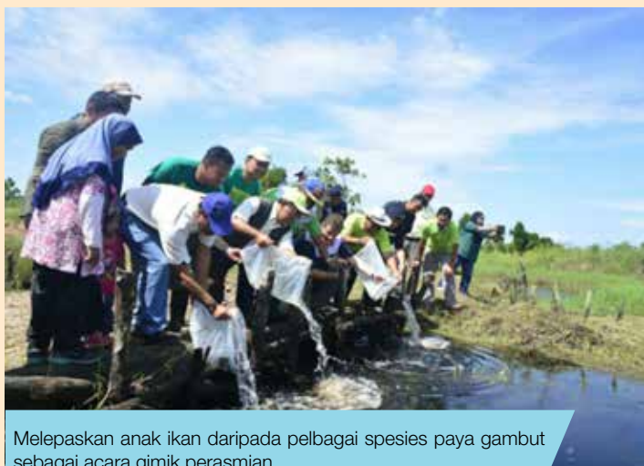
Melepaskan anak ikan daripada pelbagai spesies paya gambut sebagai acara gimik perasmian