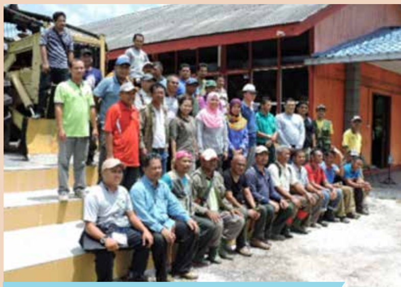
Semua peserta kursus bergambar bersama penceramah

Bahagian Latihan Perhutanan, Ibu Pejabat Jabatan Perhutanan Semenanjung Malaysia telah menganjurkan Kursus dan Penilaian Dendrologi bagi Penolong Pemelihara Hutan Gred G27 pada 18 hingga 21 April 2016 bertempat di Pusat Latihan Perhutanan Terengganu, Kuala Berang, Terengganu. Kursus ini dilaksanakan selaras dengan saranan Ketua Pengarah Perhutanan Semenanjung Malaysia untuk melatih di samping membuat penilaian berterusan bagi meningkatkan kemahiran kakitangan perhutanan dalam pengecaman pokok di lapangan. Kaedah kursus ini dijalankan dengan membuat penilaian sebelum dan selepas kursus bagi menilai kemampuan setiap peserta. Berdasarkan analisa penilaian yang dilakukan ternyata kaedah ini menunjukkan peningkatan yang ketara berbanding kaedah kursus tanpa ujian. Kursus seumpama ini telah dirancang melibatkan setiap gred dalam skim perhutanan bermula dari Gred G27 sehingga JUSA melalui modul yang ditetapkan.