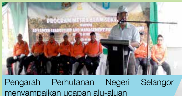
Pengarah Perhutanan Negeri Selangor menyampaikan ucapan alu-aluan