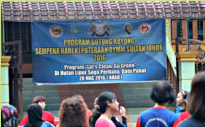
Program gotong royong dan Let's Clean Go Green di Hutan Lipur Soga Perdana