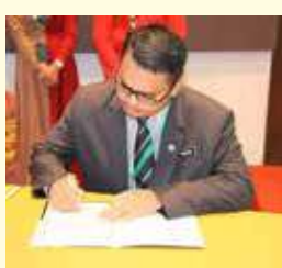
Pengarah-pengarah Perhutanan Negeri, Pengarah-pengarah Bahagian & Ketua-ketua Unit menandatangani Surat Aku Janji Pengurusan Hutan secara berkekalan bagi tahun 2016