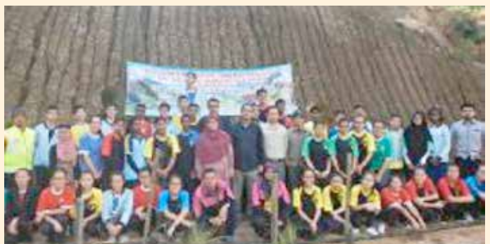
Sesi bergambar peserta Program Penghijauan Cameron Highlands