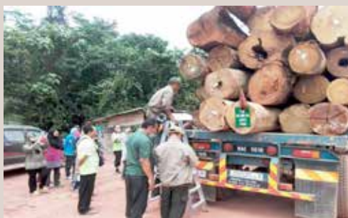
Peserta mempelajari kaedah mengukur kayu dalam lori untuk mengira cukai