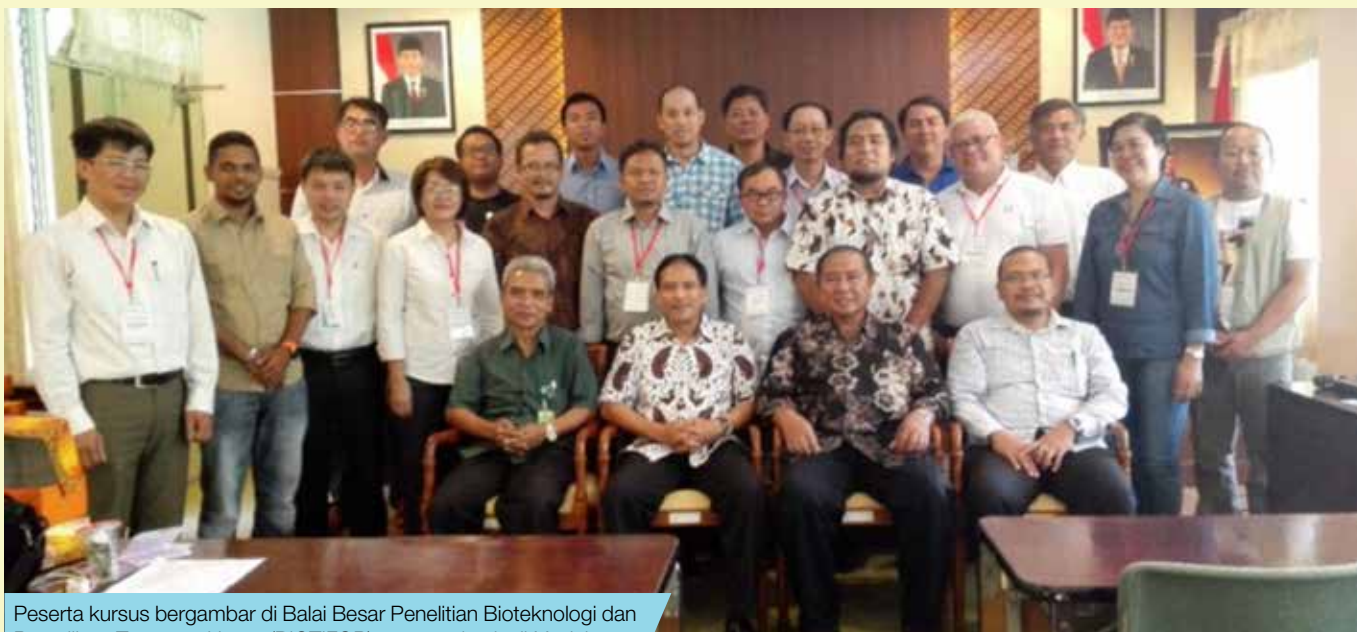
Peserta kursus bergambar di Balai Besar Penelitian Bioteknologi dan Pemuliharaan Tanaman Hutan (BIOTIFOR), yang terletak di Yogyakarta, Indonesia