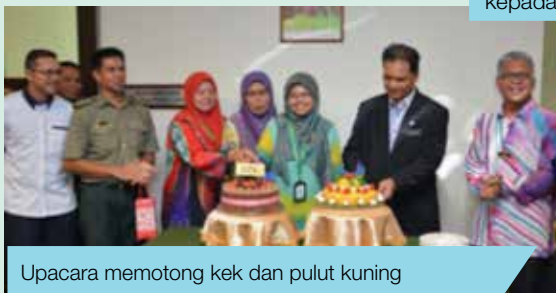
Upacara memotong kek dan pulut kuning