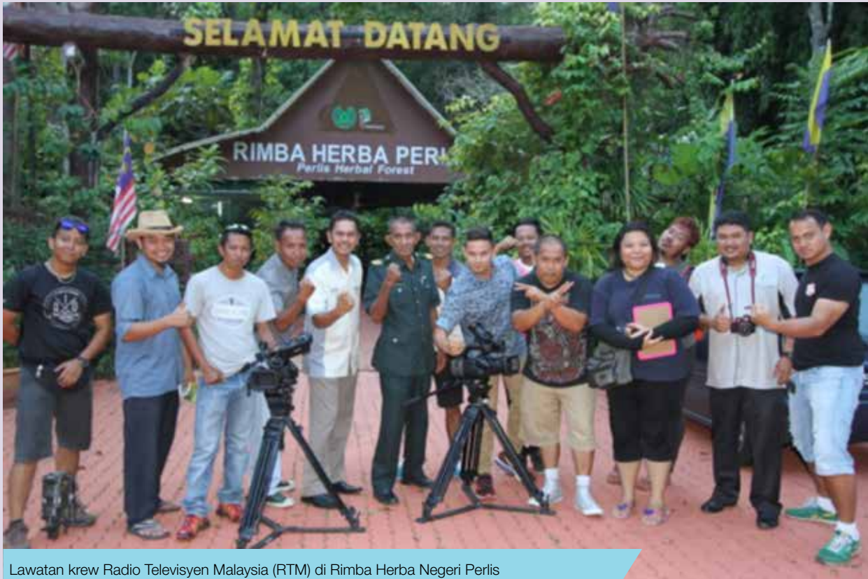
Lawatan krew Radio Televisyen Malaysia (RTM) di Rimba Herba Negeri Perlis