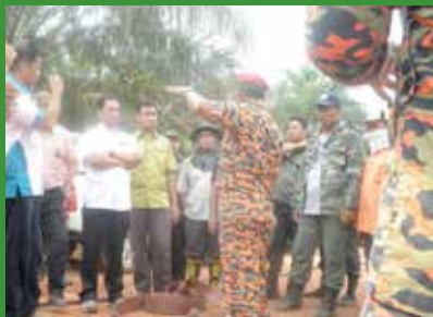
Taklimat dari pegawai BOMBA dan Penyelamat Zon Muar dan aktiviti demonstrasi pemadaman kebakaran