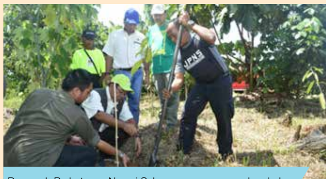
Pengarah Perhutanan Negeri Selangor menanam anak pokok

Seramai lebih daripada 300 orang peserta terdiri daripada para pelajar sekolah, kolej, agensi-agensi kerajaan dan swasta, NGO serta komuniti hadir untuk bersama-sama memeriahkan majlis sambutan disamping berpeluang menanam sebanyak 1,200 anak pokok daripada spesies Ramin melawis ( Gonystylus bancanus ) dan Tenggek burung ( Eoudia redleyi ).