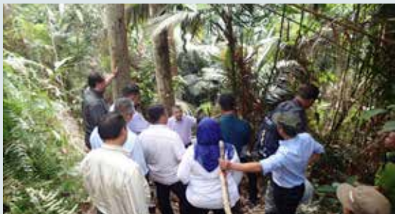
Ahli-ahli Mesyuarat Kumpulan Pakar Flora Bil. 1/2016 yang turut hadir dalam lawatan ke kawasan penemuan pokok Resak abdulrahman ( Vatica abdulrahmaniana ) di Kompartmen 127, Bukit Kledang, Hutan Simpan Kledang Saiong