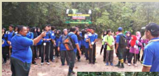
Peserta diberi penerangan mengikut kumpulan