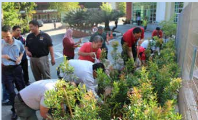
Acara penanaman pokok Kelat paya di Zon 2, Taman Rimba Wawasan yang disempurnakan oleh Pengarah-Pengarah Bahagian dan Ketua-Ketua Unit di Ibu Pejabat Jabatan Perhutanan Semenanjung Malaysia.