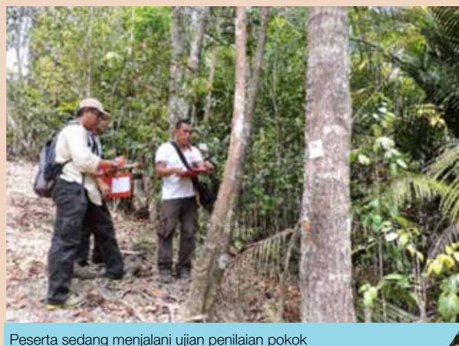
Peserta sedang menjalani ujian penilaian pokok