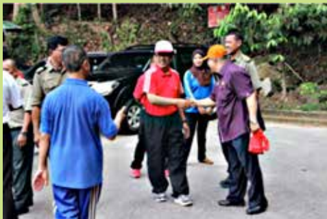
Ketibaan Tuan Pegawai Daerah Batu Pahat