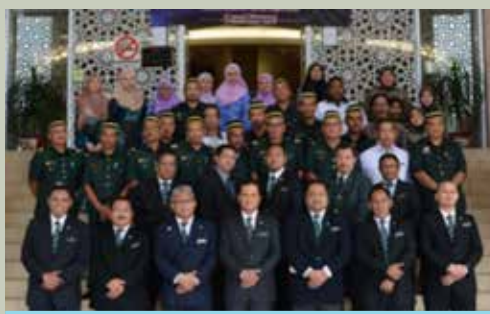
Pegawai dan kakitangan Jabatan Perhutanan Negeri Johor bergambar kenangan bersama Pengarah Perhutanan Negeri