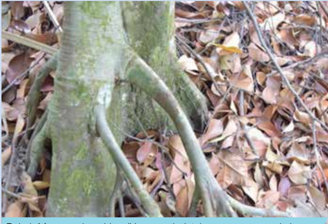
Pokok Merawan kanching ( Hopea subalata ) yang mempunyai akar jangkang