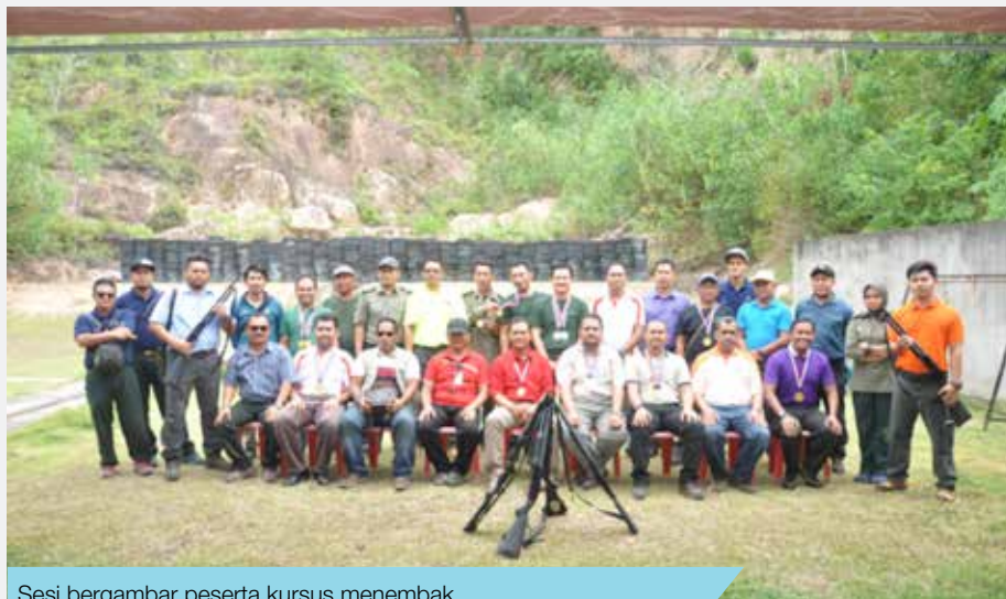
Sesi bergambar peserta kursus menembak