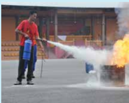
Teknik memadam kebakaran