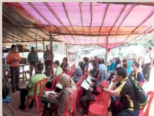
Taklimat oleh Pegawai Hutan Daerah Kuantan/Pekan/Maran di perkarangan kongsi lesen pengusahasilan

Program ini adalah kerjasama antara pihak pejabat SUK Pahang bersama dengan Jabatan Perhutanan Negeri Pahang yang bertujuan memberi pendedahan kepada pihak luar tentang pembalakan yang melibatkan pelbagai proses teknikal bermula dari penandaan pokok, penebangan pokok, pemindahan kayu balak, kutipan cukai dan sehingga kayu di bawa keluar dari kawasan lesen. Selain itu program ini juga bertujuan untuk memberi penjelasan tentang prosedur dan tanggungjawab kakitangan pakaian seragam Jabatan Perhutanan Negeri Pahang di lapangan. Kerja pembalakan sentiasa mengikut Standard Operation Prosedure (SOP) untuk menjamin kelestarian dan pemeliharaan sumber hutan yang berkekalan setiap masa.