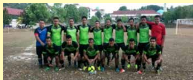
Persahabatan bola sepak dengan masyarakat setempat