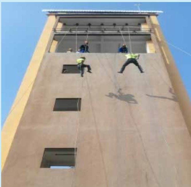
Latihan yang dikendalikan dengan rapi oleh anggota Jabatan Pertahanan Awam Malaysia

Jabatan Perhutanan Negeri Sembilan telah menganjurkan Kursus Menyelamat dan Pertolongan Cemas bagi Anggota Pasukan Jabatan Perhutanan Negeri Sembilan bertempat di Jabatan Pertahanan Awam Malaysia Negeri Sembilan bermula pada 25 hingga 28 April 2016. Kursus ini diadakan untuk memberi pengetahuan dan kemahiran di dalam keadaan kecemasan untuk Anggota "Search and Rescue" (SAR) dari Jabatan Perhutanan Negeri Sembilan. Perkara yang dititikberatkan di dalam kursus ini ialah mengenai teknik menyelamat dan juga teknik tindakan awal seperti ikatan, cara membuat balutan pada kecederaan dan juga membawa mangsa keluar dari kawasan berbahaya.