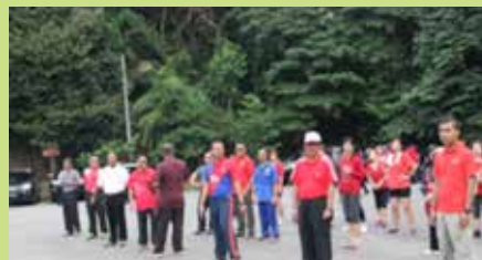
Semua peserta berbaris untuk menyanyikan lagu Negaraku dan bermulanya acara J-Robik .