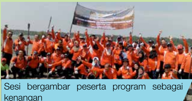
Sesi bergambar peserta program sebagai kenangan

Secara keseluruhannya, program ini berjalan dengan lancar dan semua peserta menunjukkan komitmen yang tinggi serta ceria di sepanjang program ini berlangsung. Di samping itu, peserta juga berkesempatan menaiki kapal milik Jabatan Laut Wilayah Tengah Pelabuhan Klang.