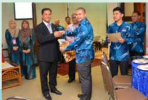
Penyampaian cenderahati daripada Pegawai Hutan Daerah Johor Tengah kepada Pengarah Perhutanan Negeri Johor