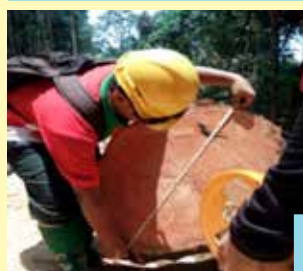
Pelatih menjalani latihan amali di lapangan