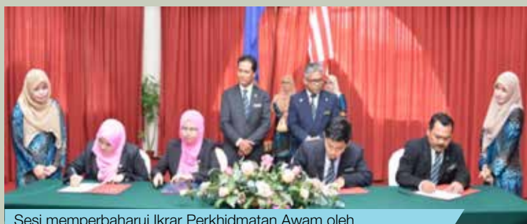
Sesi memperbaharui Ikrar Perkhidmatan Awam oleh Ketua Unit/Bahagian