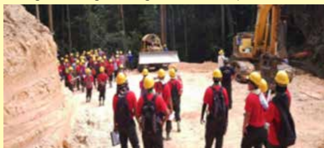
Lawatan Penguatkuasaan Syarat-syarat Lesen Membalak dan menyediakan Laporan Penutup (CR) di kawasan Pengusahaan di Daerah Kinta-Manjung