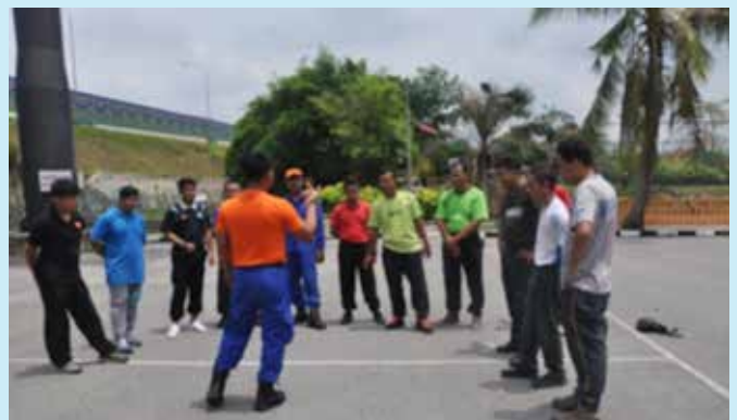
Peserta kursus diberikan taklimat oleh Pegawai Jabatan Pertahanan Awam Malaysia