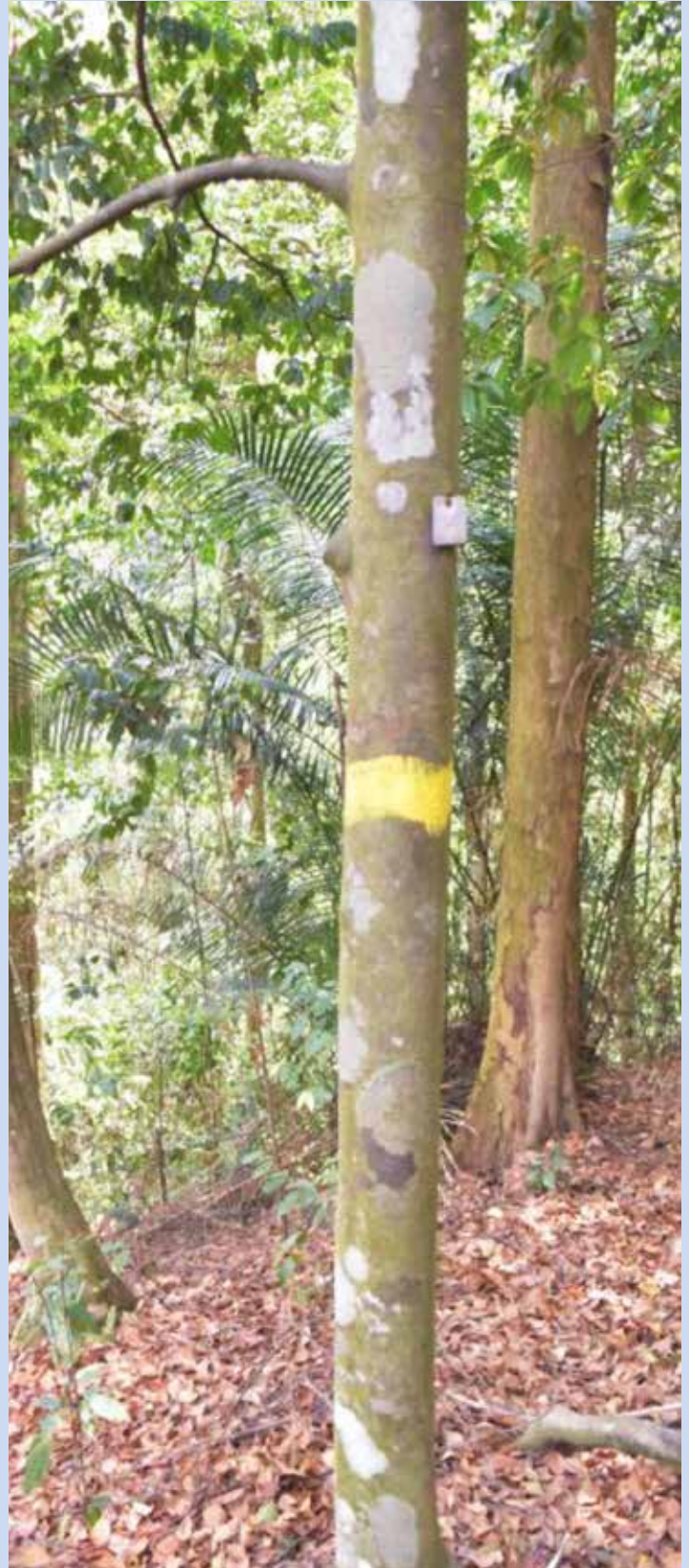
Anak pokok Merawan kanching ( Hopea subalata )

Antara ciri-ciri fizikal pada spesies ini adalah merupakan pokok yang mampu mencapai ketinggian maksimum 20m dengan diameter maksimum 30 cm. Spesies ini mempunyai bentuk batang yang kecil dan jarang besar serta berjangkang. Warna kulit dalam dan sapwood adalah krim kekuningan dan tidak berdamar. Merawan kanching berbeza dengan spesies Merawan yang lain kerana ia mempunyai akar tergantung yang kecil. Urat daun kedua ( secondary vein ) hampir sama dengan pokok kapur tetapi intermediate nerve agak kurang dan jarang serta lebih pendek atau dipanggil urat sesat.