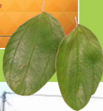
Bentuk daun pokok bidara