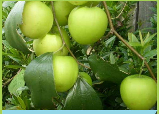
Buah Bidara yang seakan buah Epal hijau