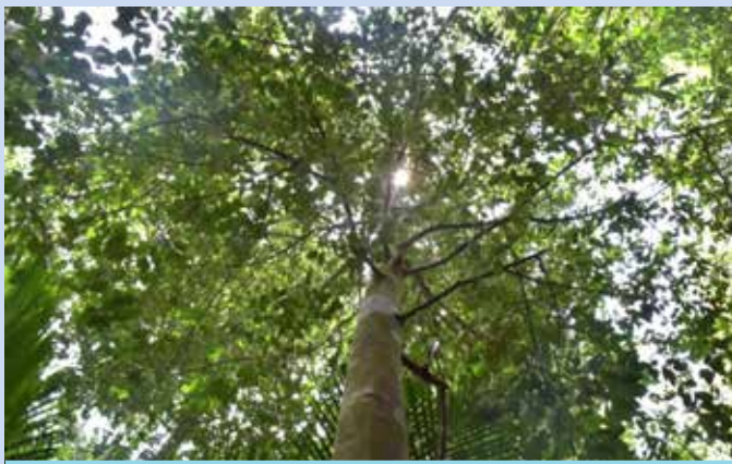
Silira pokok Merawan kanching ( Hopea subalata )

HCVF adalah untuk memelihara kawasan hutan yang mempunyai nilai pemeliharaan tinggi selaras dengan ketetapan Standard Malaysian Criteria and Indicator for Forest Management Certification (Natural Forest) . Penubuhan HCVF ini dikelaskan di bawah HCVF I iaitu kawasan hutan yang mempunyai nilai biodiversiti yang penting di peringkat global, serantau dan kebangsaan. Terdapat 2 pokok yang telah mencapai diameter 30cm di kawasan ini yang boleh dijadikan pokok ibu dan purata taburan pokok di kawasan ini yang mempunyai diameter pokok melebihi 5cm adalah 32.