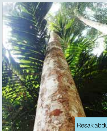
Resak abdulrahman ( Vatica abdulrahmaniana )

Tujuan mesyuarat ini diadakan adalah untuk membincangkan tiga (3) matlamat iaitu Penyediaan draf Panduan Pengenalan dan Pengecaman Spesies Flora, draf Standard Operating Procedure (SOP) Pengurusan dan Pengumpulan Herbarium dan draf Garis Panduan Penamaan Pokok Dalam Kawasan Taman Eko Rimba di Semenanjung Malaysia yang telah dipersetujui semasa Mesyuarat KPF JPSM Bil.3/2015 yang diadakan di Bilik Mesyuarat Kesidang, Perbadanan Kemajuan Negeri Melaka pada 10 Disember 2015.