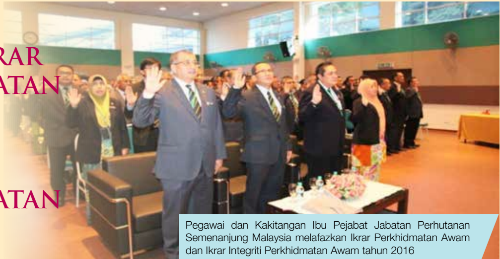
Pegawai dan Kakitangan Ibu Pejabat Jabatan Perhutanan Semenanjung Malaysia melafazkan Ikrar Perkhidmatan Awam dan Ikrar Integriti Perkhidmatan Awam tahun 2016