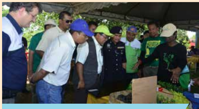
Tetamu jemputan melawat booth pameran