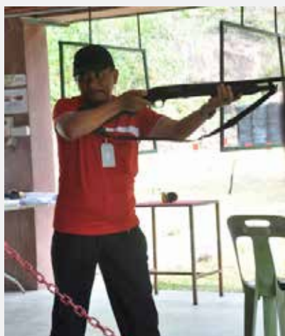
Jurulatih dari Pesatuan Menembak Johor sedang memberi taklimat pengendalian senjata api