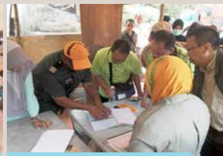
Pemeriksaan kaedah kutipan cukai di Balai pemeriksa Hutan