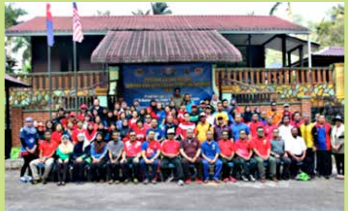
Semua peserta bergambar bersama Pegawai Daerah