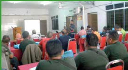
Kursus Pencegahan dan Pengendalian Jentera Kebakaran Hutan sedang berlangsung