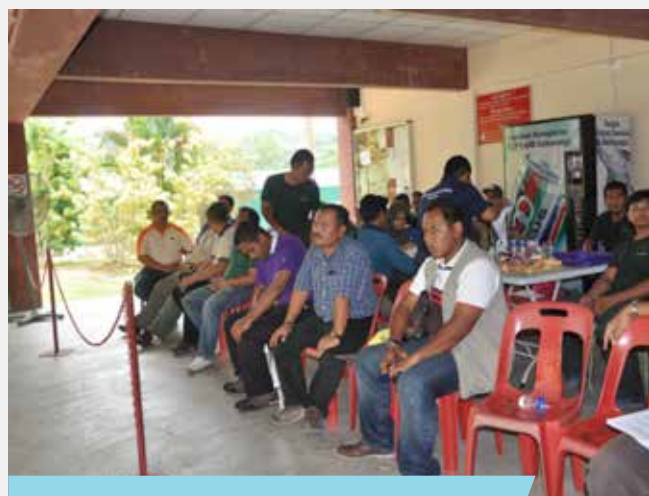
Peserta kursus sedang menjalani latihan menembak