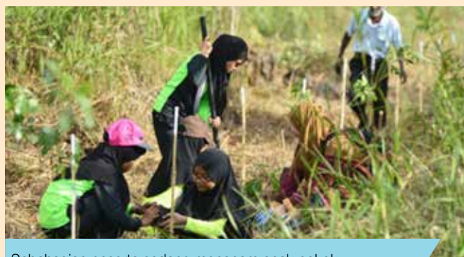
Sebahagian peserta sedang menanam anak pokok