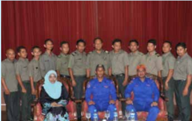
Peserta kursus dan Anggota Jabatan Pertahanan Awam Malaysia mengambil gambar kenangan.