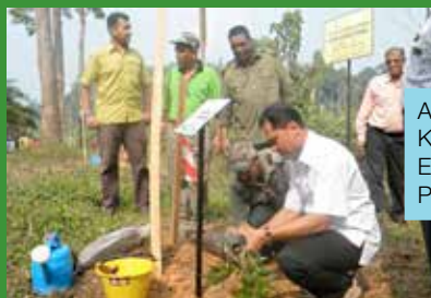
Aktiviti menanam pokok spesis Kelat Merah ( Syzygium sp ) oleh Encik Ridza bin Awang, Pengarah Perhutanan Negeri Johor

Secara keseluruhannya, sambutan Hari Hutan Antarabangsa Peringkat Pejabat Hutan Daerah Johor Utara Tahun 2016 telah berlangsung dengan jayanya dan mencapai objektif dalam melibatkan masyarakat setempat untuk sama-sama menghargai kepentingan hutan dalam kehidupan sejagat.