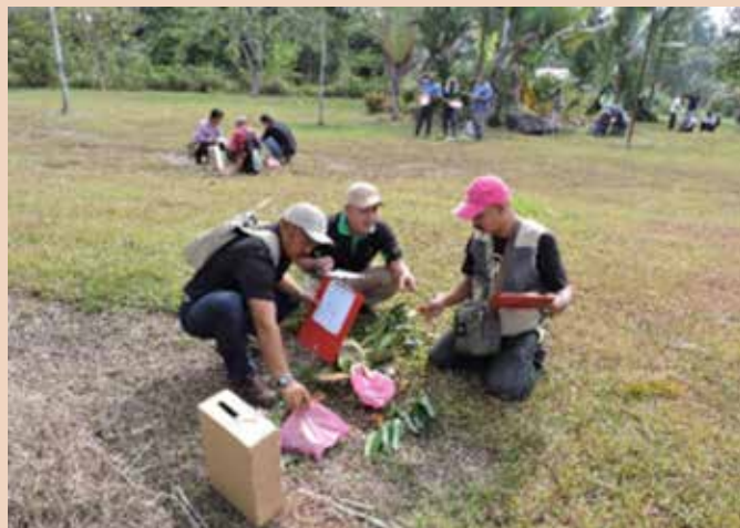
Ujian pengecaman sedang dijalankan