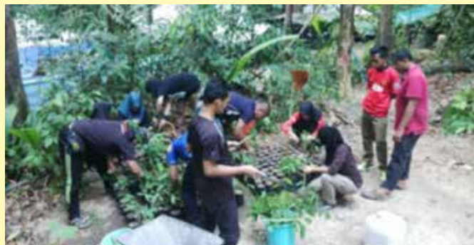
Aktiviti mengutip anak liar untuk penanaman semula di kawasan perkhemahan