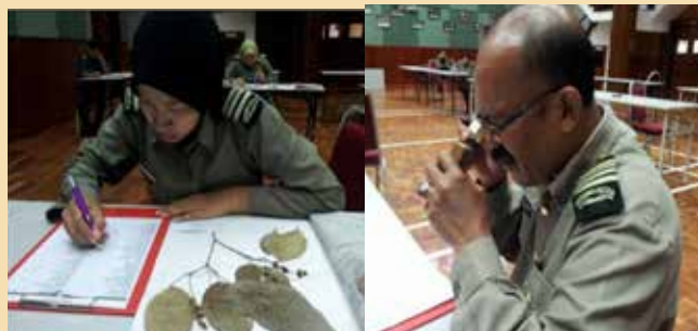
Calon sedang menjawab ujian pengecaman spesimen Herbarium (gambar kiri) dan Isi Kayu (gambar kanan)

Ujian Khas Penolong Pemelihara Hutan / Renjer Hutan Gred G27 dan Pengawas Hutan Gred G17 Tahun 2016 telah diadakan dalam dua (2) siri. Siri satu (1) diadakan pada 4 Februari 2016 bertempat di Dewan Alwy, Bahagian Latihan Perhutanan Kepong. Manakala siri kedua (2) diadakan bermula 10 Mac 2016 hingga 16 Mac 2016 bertempat di Pejabat Perhutanan Negeri Selangor, Kedah dan Kelantan. Ujian ini bertujuan untuk menilai kompetensi pegawai dalam pengecaman spesimen herbarium dan pengecaman spesimen isi kayu.