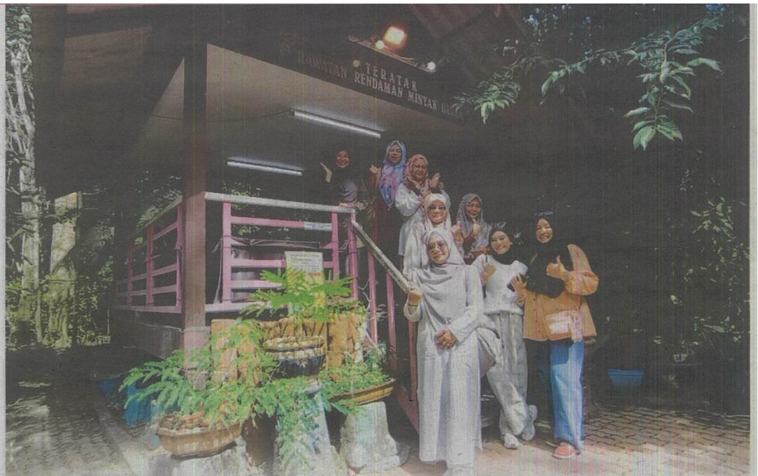
ANTARA pengunjung yang meluangkan masa di Rimba Herba Perlis.

Selain menawarkan ruang pameran, informasi tanaman dan jualan, Rimba Herba Perlis juga menyediakan kawasan rehat seperti meja serta kerusi termasuk