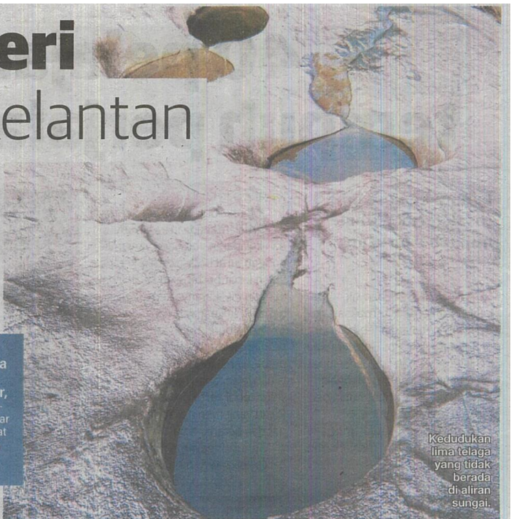
Kedudukan lima telaga yang tidak berada di aliran sungai.