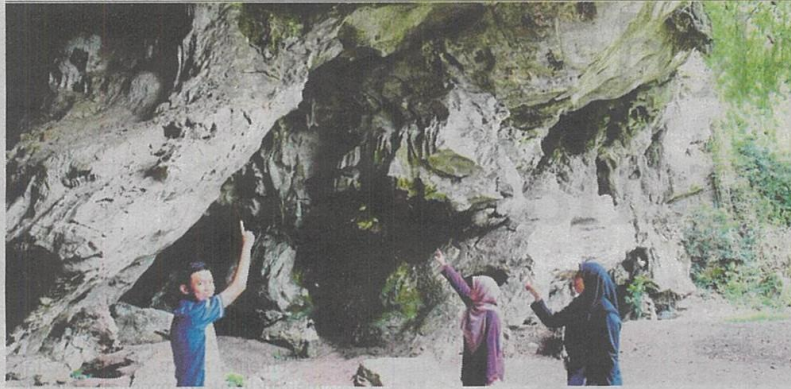
Lenggong Geopark di Perak memperoleh status Green Card.