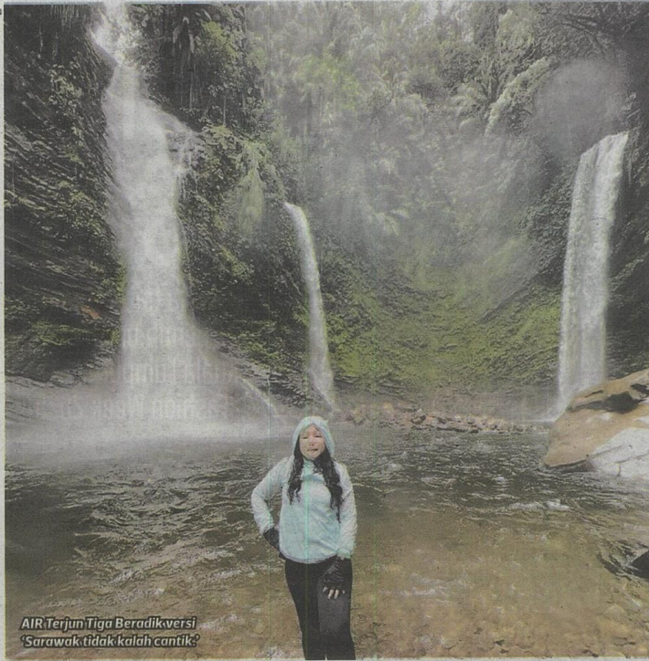
AIR Terjun Tiga Beradik versi 'Sarawak tidak kalah cantik?'