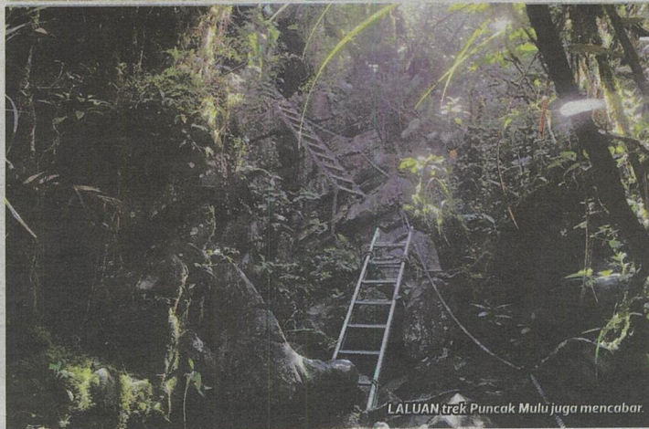
LALUAN trek Puncak Mulu juga mencabar.