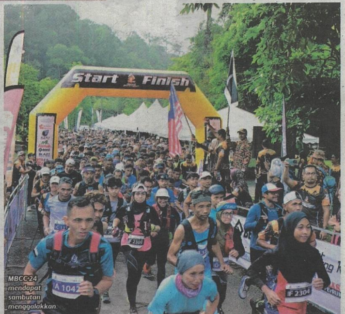
MBCC24 mendapat sambutan menggalakkan

"Berkaitan aktiviti pendakian Gunung Berembun pula, mereka yang ingin mendaki perlu mendapatkan permit Memasuki Hutan Simpanan Kekal di Pejabat Hutan Daerah Terengganu Selatan, Bandar Dungun dengan kadar bayaran RM10 seorang. Permohonan perlu dibuat sekurang-kurangnya dua minggu sebelum tarikh pendakian," katanya.