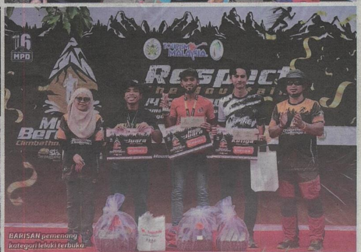
BARISAN pemenang kategori lelaki terbuka