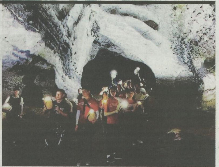
GUA batu kapur Merapoh merupakan kawasan yang diiktiraf Lipis Geopark Kebangsaan.