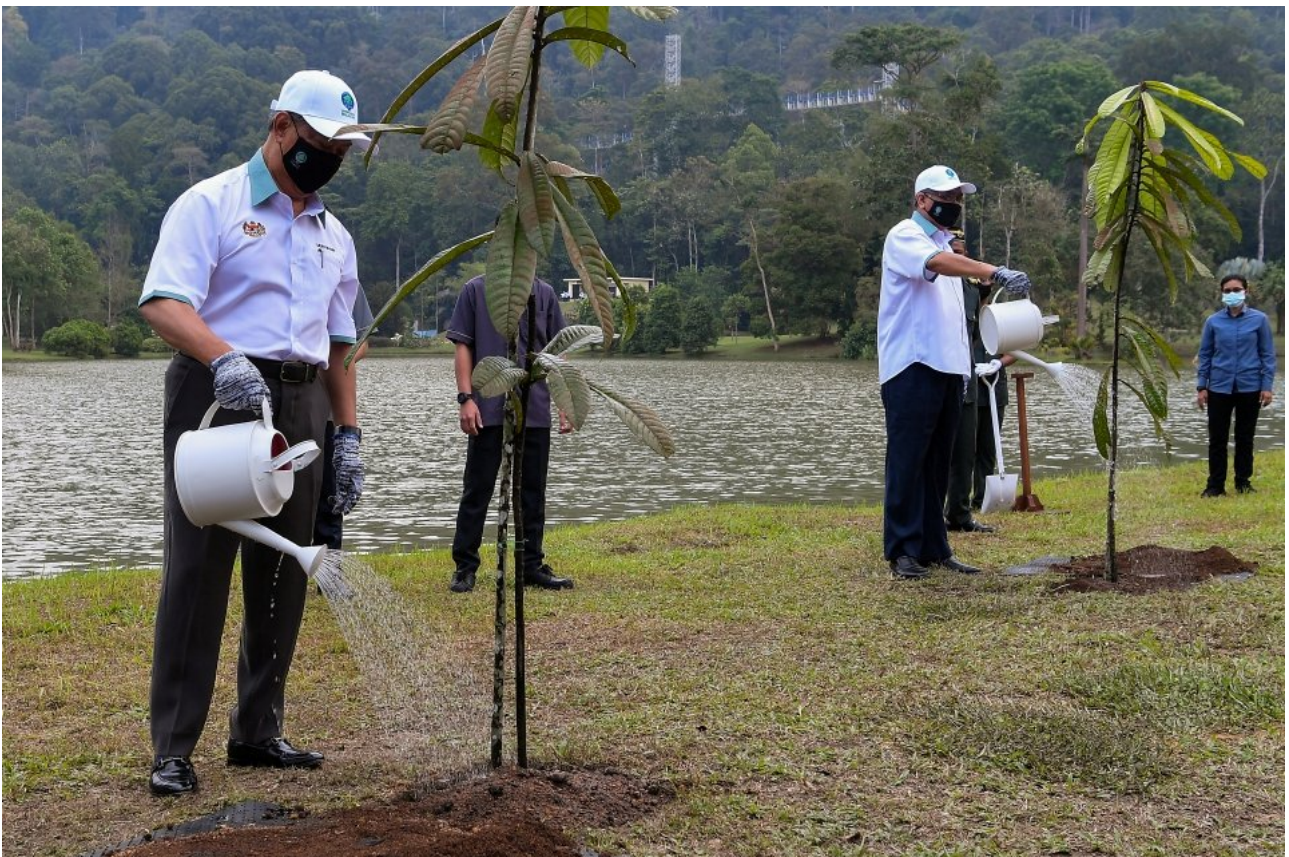
Perdana Menteri Tan Sri Muhyiddin Yassin bersama Menteri Tenaga dan Sumber Asli Datuk Seri Dr Shamsul Anuar Nasarah (kanan) menyiram pokok Resak yang ditanamnya pada Majlis Pelancaran Dasar Perhutanan Malaysia sempena Sambutan Hari Hutan Antarabangsa peringkat kebangsaan tahun 2021 di Taman Botani Kepong, Institut Penyelidikan Perhutanan Malaysia (FRIM) hari ini.

"Saya menyeru kerajaan negeri melipat gandakan usaha untuk memulihkan kawasan hutan terosot melalui penyelesaian berasaskan alam semulajadi terutama dalam Kawasan Sensitif Alam Sekitar," katanya.