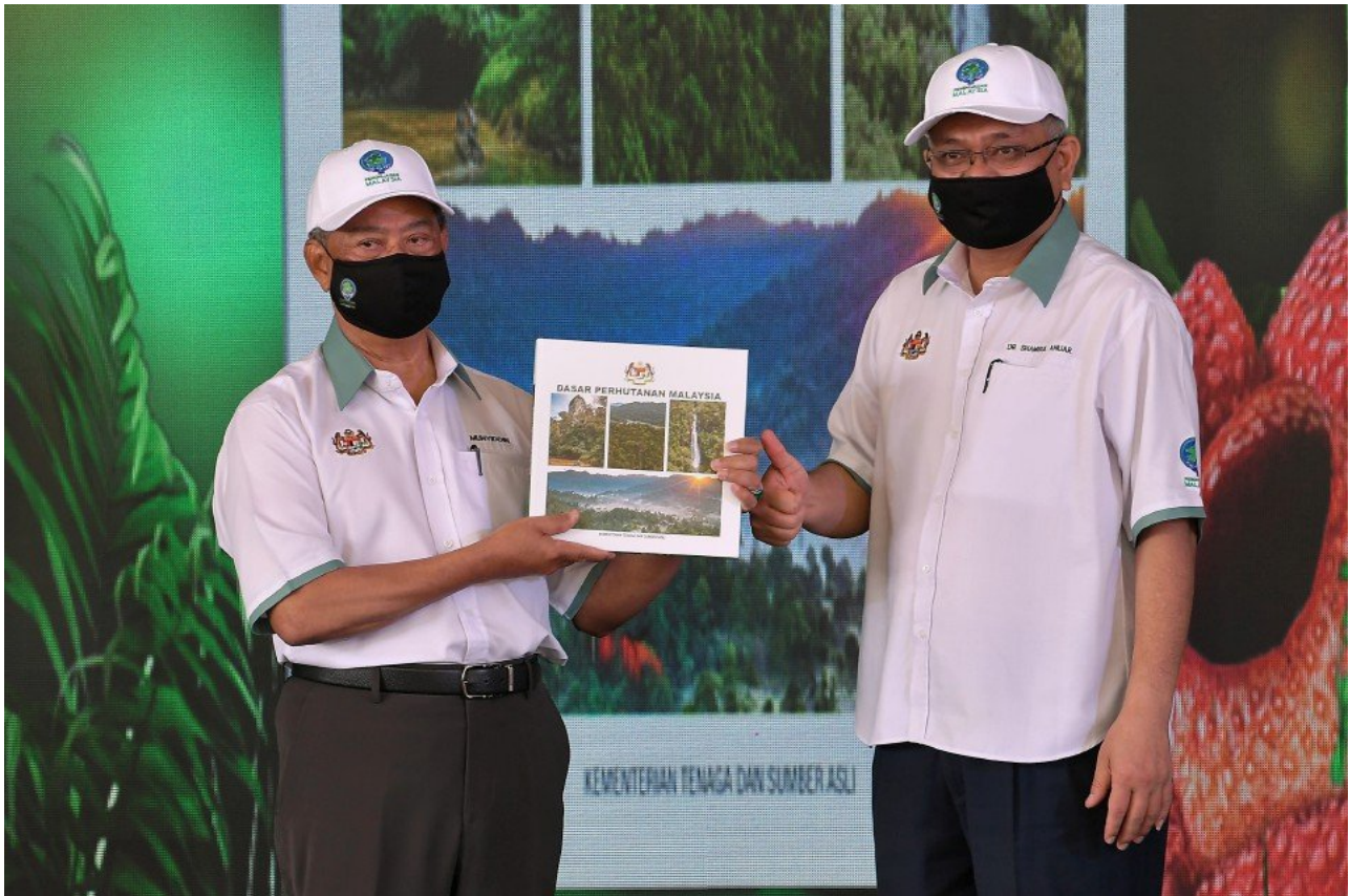
Perdana Menteri, Tan Sri Muhyiddin Yassin, menunjukkan buku Dasar Perhutanan Malaysia dengan diiringi oleh Menteri Tenaga dan Sumber Asli, Datuk Seri Dr Shamsul Anuar Nasarah.

Beliau berkata demikian ketika melancarkan Dasar Perhutanan Malaysia sempena Sambutan Hari Hutan Antarabangsa 2021 peringkat kebangsaan di Institut Penyelidikan Perhutanan Malaysia (FRIM), Kepong, hari ini.