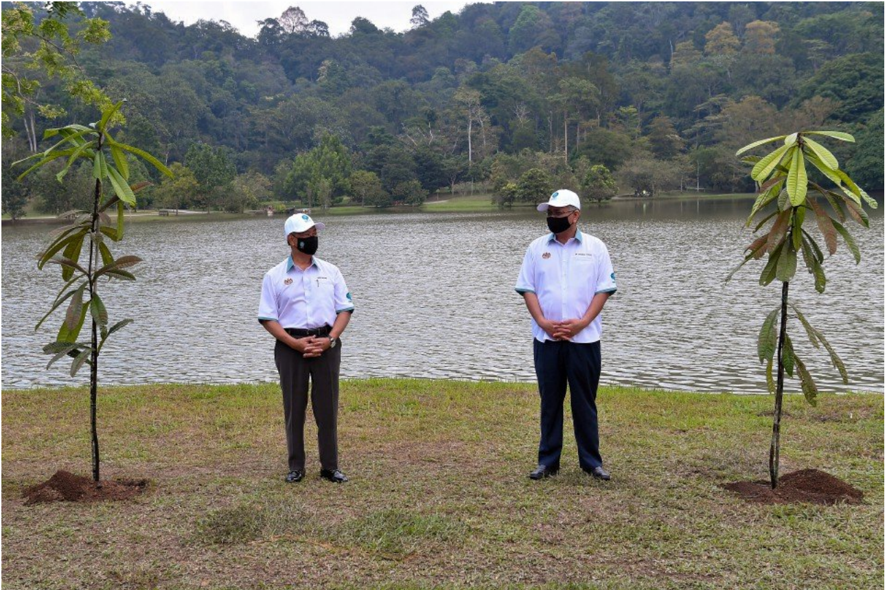
Tan Sri Muhyiddin Yassin bersama Menteri Tenaga dan Sumber Asli Datuk Seri Dr Shamsul Anuar Nasarah (kanan) bergambar bersebelahan pokok Resak yang ditanamnya pada Majlis Pelancaran Dasar Perhutanan Malaysia sempena Sambutan Hari Hutan Antarabangsa peringkat kebangsaan tahun 2021 di Taman Botani Kepong, Institut Penyelidikan Perhutanan Malaysia (FRIM) hari ini.