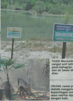
TASIK Meromiktik sangat unik iaitu pada bahagian dasar dan air tawar di atas.