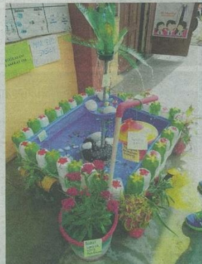
ANTARA reka cipta yang dihasilkan oleh para peserta.