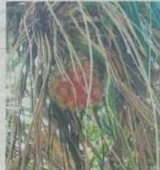
ANTARA spesies tumbuhan yang dapat dilihat di hutan Teluk Bahang.

Ujar beliau digunakan se penduduk Pulau Pinang. Ia membuktikan bahawa hutan merupakan kawasan tadahan air dan perlu dipelihara agar tidak musnah untuk manusia dapat bekalan air yang bersih. Pokok-pokok menjadi agen seperti span untuk menyimpan air hujan dan air bumi serta mengalirkan secara perlahan ke tasik berkenaan. Pada hari kedua, semua peserta memasuki Taman Negara Pulau Pinang yang mengambil masa selama tiga jam. Kepadatan mereka berbaloi kerana dapat melihat keindahan hutan di sekitar Taman Negara Pulau Pinang. Tambahnya, peserta-peserta juga diberi tugas untuk mengambil gambar yang menarik berkaitan tema air dan hutan. Kembarnya mereka diteruskan ke Pantai Kerachut dan berpeluang