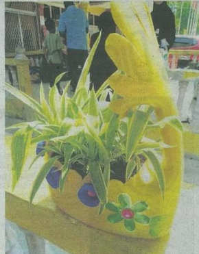
BOTOL plastik boleh dikitar semula untuk dijadikan hiasan menarik.